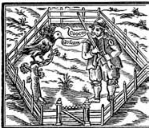
Printed at London by E. A. and T. F. for Mich[el] Sparke, dwelling in Grove Arber at the signe of the Blue-Bible, 1630.

Gathered together by A. B. of Physicke Doctor.