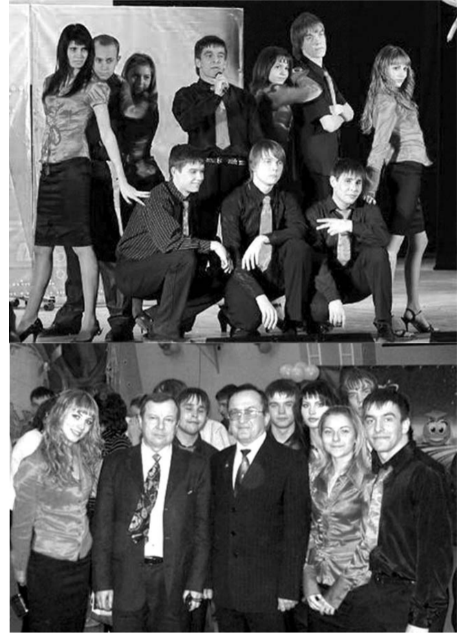
Пенза. Четвертьфинал Пензенской областной лиги КВН